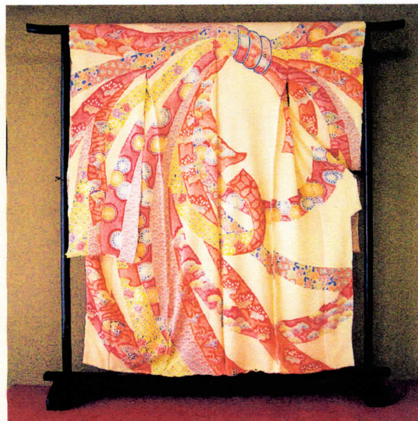
絞り着物 同時展示

絞り染めは、日本では千数百年も前から行われており、 宮廷衣装の紋様表現として用いられてきました。括り の模様が仔鹿の背模様 （鹿の子） の斑点に似ているところから 「鹿の子絞り」と言われます。室町時代から安土・桃山 時代にかけては、辻が花染めが盛んになり、江戸時代 中期には鹿の子絞りの全盛期を迎えました。現在も縮 絞り着物は女性の憧れです。しかし、後継者不足という 事態が今後のものづくりに大きな影響が出ています。 これから先も伝えていき、発展させていくことが私たち の使命です。